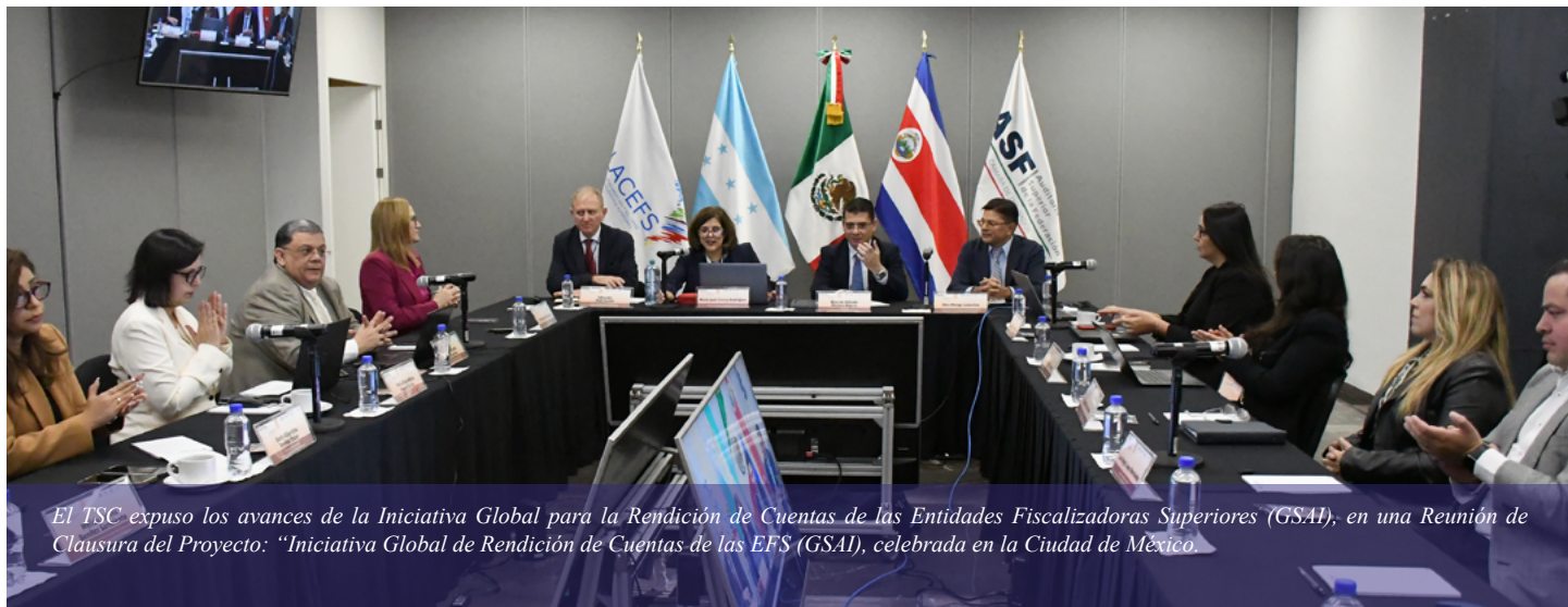
El TSC expuso los avances de la Iniciativa Global para la Rendición de Cuentas de las Entidades Fiscalizadoras Superiores (GSAI), en una Reunión de Clausura del Proyecto: “Iniciativa Global de Rendición de Cuentas de las EFS (GSAI), celebrada en la Ciudad de México.

Ciudad de México. El Tribunal Superior de Cuentas (TSC) expuso los avances de la Iniciativa Global para la Rendición de Cuentas de las Entidades Fiscalizadoras Superiores (GSAI), de la cual es beneficiario para el fortalecimiento de las capacidades de fiscalización de los bienes y recursos del Estado.