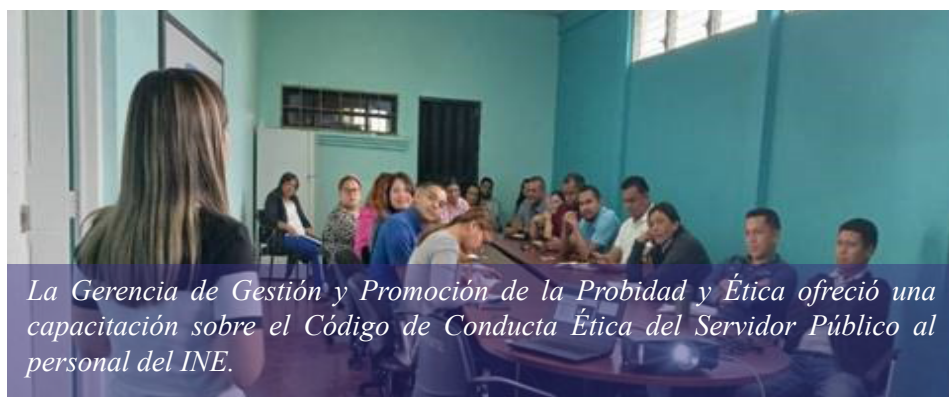
La Gerencia de Gestión y Promoción de la Probidad y Ética ofreció una capacitación sobre el Código de Conducta Ética del Servidor Público al personal del INE.

De esta forma, el TSC cumple con el mandato legal de promover la conformación de los Comités de Probidad y Ética en las instituciones del Sector Público, con el fin de incentivar el cumplimiento de las normas de conducta ética y transparencia del personal de la entidad estatal.