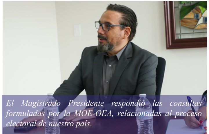
El Magistrado Presidente respondió las consultas formuladas por la MOE-OEA, relacionadas al proceso electoral de nuestro país.

La petición fue canalizada a través de la Secretaría de Relaciones Exteriores, sobre la cual el Magistrado Presidente respondió afirmativamente y el encuentro con la delegación de la MOE OEA se llevó a cabo el miércoles 25 de noviembre, en el salón del Pleno.