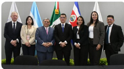
TRIBUNAL SUPERIOR DE CUENTAS DESTACA AVANCES DE CUMPLIMIENTO DE LA INICIATIVA GSAI