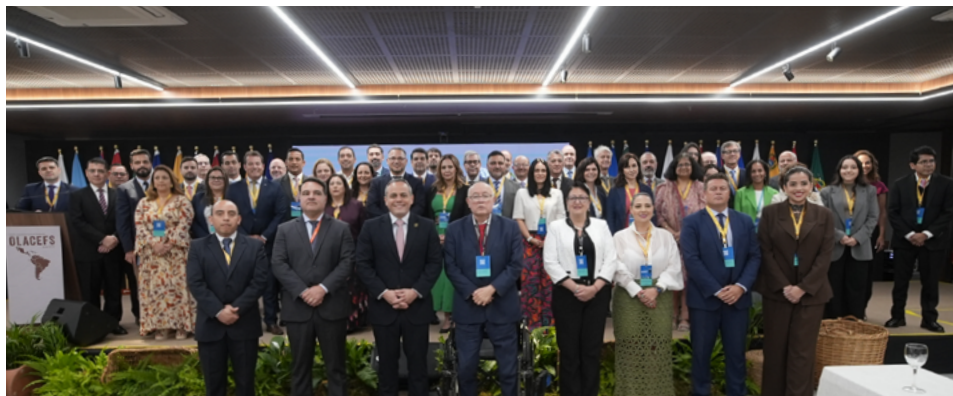
Foto oficial de la XXXIV Asamblea General 2025 de la OLACEFS celebrado en Fortaleza, Brasil, la cual reunió a las autoridades de las EFS miembros y se centró en temas como la innovación pública y el control interno para promover la transparencia y la rendición de cuentas.

Fortaleza, Brasil. El Tribunal Superior de Cuentas (TSC) participó en la XXXIV Asamblea General de la Organización Latinoamericana y del Caribe de Entidades Fiscalizadoras Superiores (OLACEFS), celebrada en Brasil del 26 al 28 de noviembre de 2025.