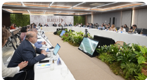
TSC PARTICIPÓ EN LA XXXIV ASAMBLEA GENERAL ORDINARIA DE LA OLACEFS