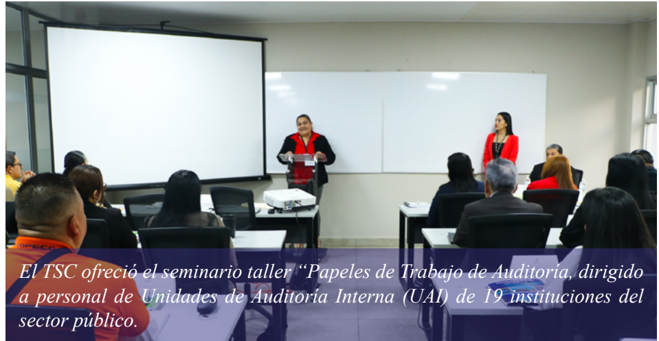
El TSC ofreció el seminario taller “Papeles de Trabajo de Auditoría, dirigido a personal de Unidades de Auditoría Interna (UAI) de 19 instituciones del sector público.

Fue dirigido a 61 colaboradores de 19 UAI, de igual número de instituciones, con la finalidad de fortalecer sus capacidades en las labores de fiscalización en las instituciones que representan, lineamientos impartidos