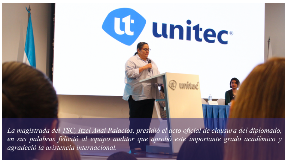
La magistrada del TSC, Itzel Anai Palacios, presidió el acto oficial de clausura del diplomado, en sus palabras felicitó al equipo auditor que aprobó este importante grado académico y agradeció la asistencia internacional.

Asimismo, agradeció a la UNODC y a la UNITEC, por facilitar el valioso apoyo