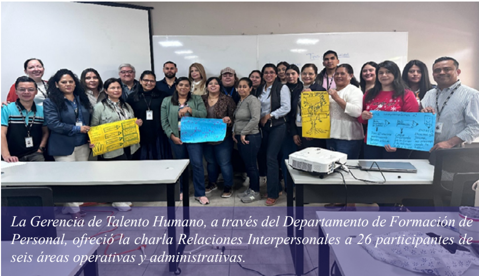
La Gerencia de Talento Humano, a través del Departamento de Formación de Personal, ofreció la charla Relaciones Interpersonales a 26 participantes de seis áreas operativas y administrativas.

Tegucigalpa. El Tribunal Superior de Cuentas (TSC) incentiva la relación interpersonal entre los funcionarios y empleados de la institución.