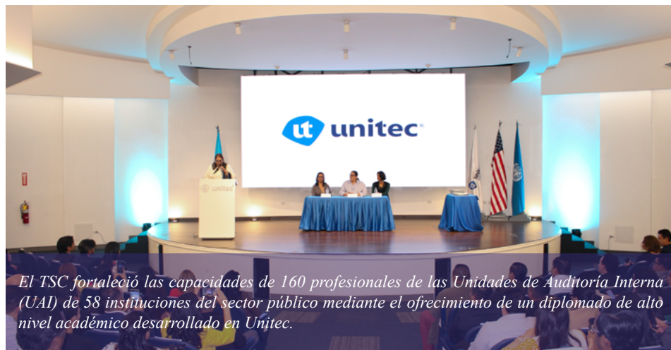
El TSC fortaleció las capacidades de 160 profesionales de las Unidades de Auditoría Interna (UAI) de 58 instituciones del sector público mediante el ofrecimiento de un diplomado de alto nivel académico desarrollado en Unitec.

Se ofreció a personal auditor de las UAI con el objetivo de fortalecer las capacidades técnicas y éticas de los