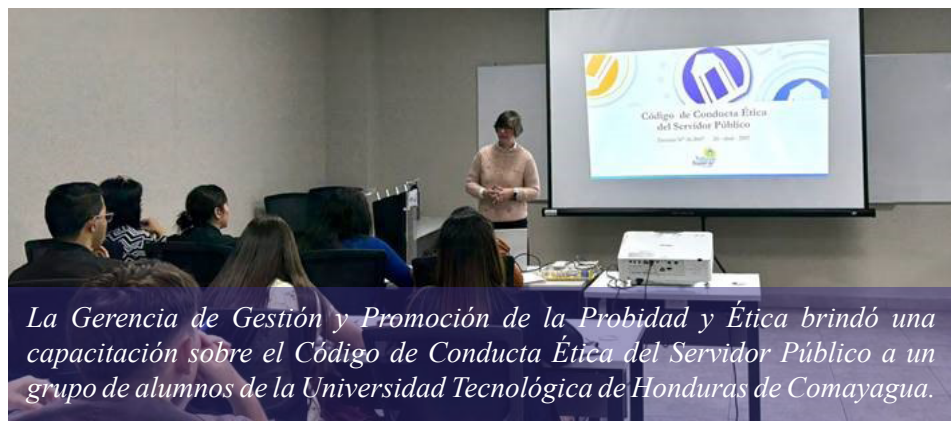
La Gerencia de Gestión y Promoción de la Probidad y Ética brindó una capacitación sobre el Código de Conducta Ética del Servidor Público a un grupo de alumnos de la Universidad Tecnológica de Honduras de Comayagua.

La jornada instructiva fue facilitada por