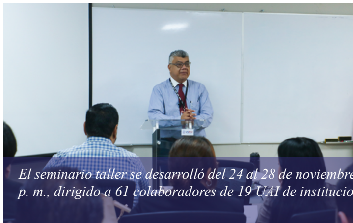
El seminario taller se desarrolló del 24 al 28 de noviembre, 2025, en el Cencacorp, en un horario de 8:30 a. m. a 4:30 p. m., dirigido a 61 colaboradores de 19 UAI de instituciones públicas.