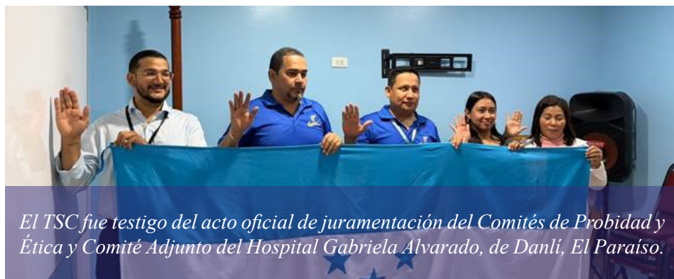
El TSC fue testigo del acto oficial de juramentación del Comités de Probidad y Ética y Comité Adjunto del Hospital Gabriela Alvarado, de Danlí, El Paraíso.