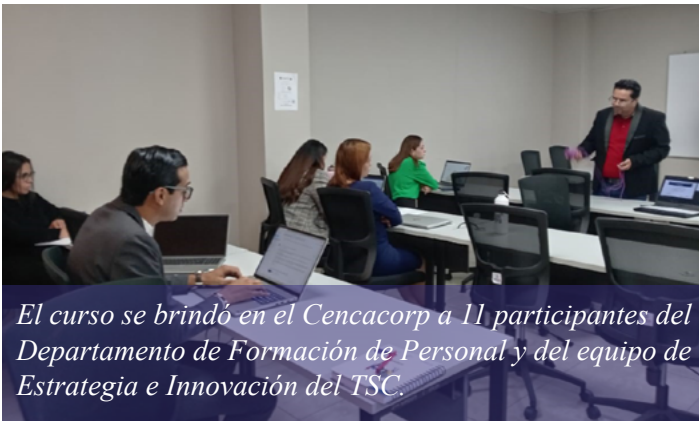
El curso se brindó en el Cencacorp a 11 participantes del Departamento de Formación de Personal y del equipo de Estrategia e Innovación del TSC.

El curso fue coordinado por la Gerencia de Talento Humano, a través del Departamento de Formación de Personal.