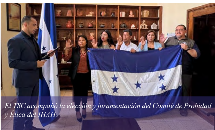
El TSC acompañó la elección y juramentación del Comité de Probidad y Ética del IHAH.

Durante estas actividades, servidores públicos recibieron formación sobre