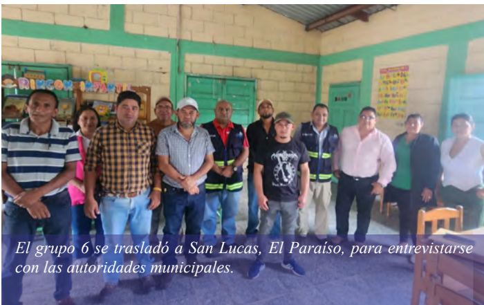
El grupo 6 se trasladó a San Lucas, El Paraíso, para entrevistarse con las autoridades municipales.