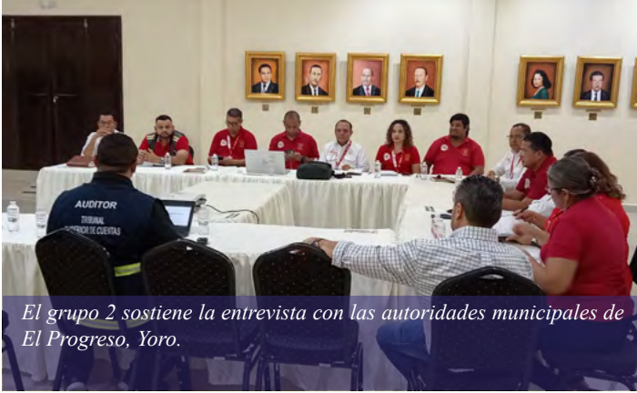
El grupo 2 sostiene la entrevista con las autoridades municipales de El Progreso, Yoro.

La iniciativa de conocer la situación que enfrentan las municipalidades de Honduras la impulsa el TSC en el ejercicio de las atribuciones establecidas en la Constitución de la República, la Ley Orgánica y su reglamento.