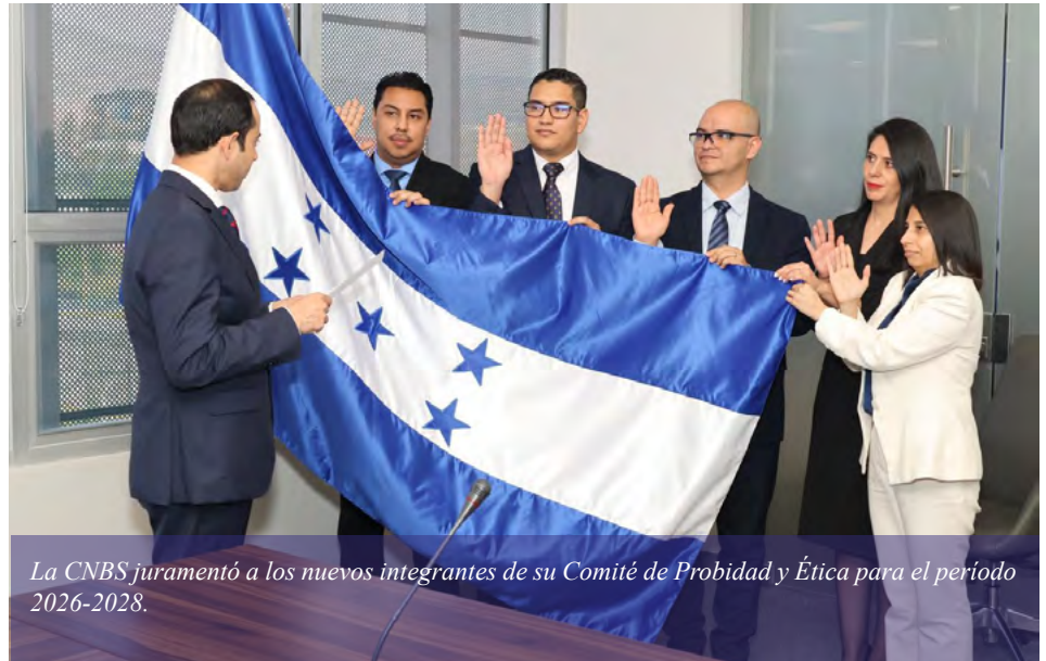
La CNBS juramentó a los nuevos integrantes de su Comité de Probidad y Ética para el período 2026-2028.

Asimismo, el TSC acompañó los procesos de elección y juramentación