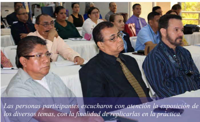
Las personas participantes escucharon con atención la exposición de los diversos temas, con la finalidad de replicarlas en la práctica.

Con la puesta en marcha de este plan integral de formación, el TSC destaca la importancia del cumplimiento de las recomendaciones emitidas en sus informes de auditoría, como una herramienta clave para corregir hallazgos, fortalecer los controles internos y mejorar la gestión pública.