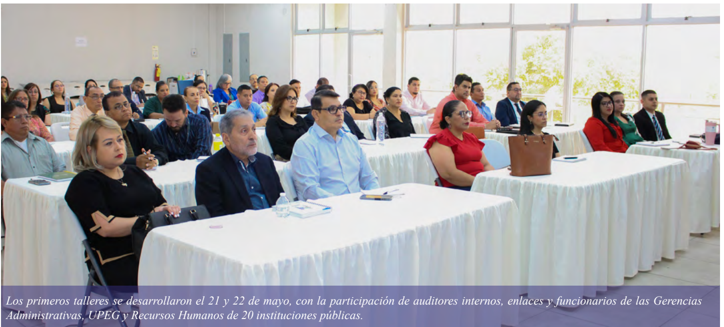
Los primeros talleres se desarrollaron el 21 y 22 de mayo, con la participación de auditores internos, enlaces y funcionarios de las Gerencias Administrativas, UPEG y Recursos Humanos de 20 instituciones públicas.

Las sesiones iniciales se llevaron a cabo en las instalaciones del Centro de Capacitación para el Control de los Recursos Públicos (Cencacorp). En este