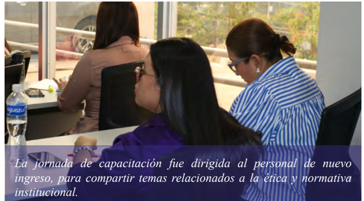
La jornada de capacitación fue dirigida al personal de nuevo ingreso, para compartir temas relacionados a la ética y normativa institucional.