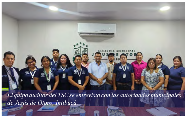
El equipo auditor del TSC se entrevistó con las autoridades municipales de Jesús de Otoro, Intibucá.

El proyecto inició en marzo y continuó en la semana del 4 al 8 de mayo con la visita a 120 municipalidades de los departamentos de Lempira, Intibucá, Copán, Ocotepeque, Yoro, El Paraíso, Comayagua y Olancho para lo cual se desplazaron ocho comisiones compuestas por auditores del ente contralor.