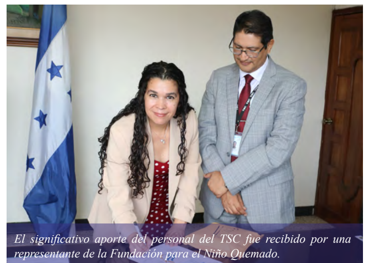
El significativo aporte del personal del TSC fue recibido por una representante de la Fundación para el Niño Quemado.

Ante el aumento de casos de menores con quemaduras y la insuficiencia de la capacidad instalada, se impulsó la gestión para la creación de un centro especializado, lo que permitió la apertura del Centro Hondureño para el Niño Quemado en 2018, fortaleciendo así la atención integral a esta población.