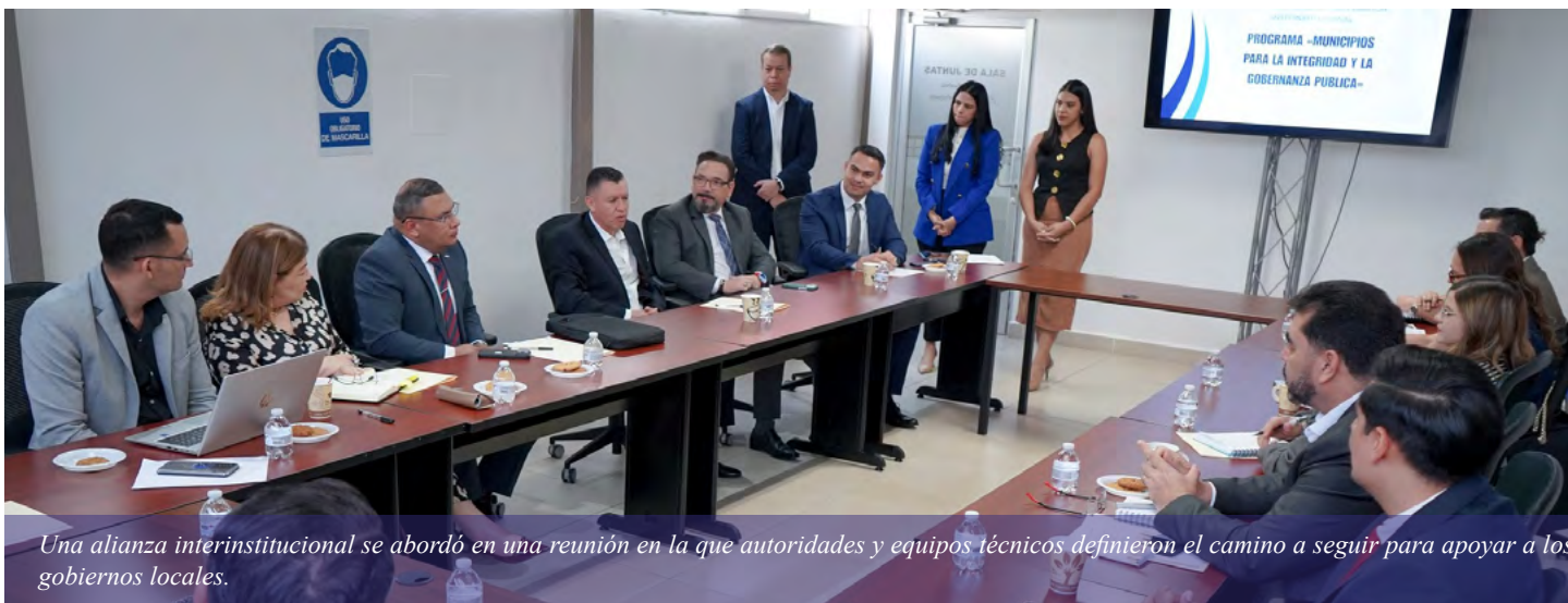
Una alianza interinstitucional se abordó en una reunión en la que autoridades y equipos técnicos definieron el camino a seguir para apoyar a los gobiernos locales.

Entre ellas, la iniciativa de Fortalecimiento y Control Municipal, la asistencia para la presentación del Informe de Rendición de Cuentas Anual Acumulado, el seguimiento de recomendaciones de auditoría y el respaldo a Unidades de Auditoría Interna.