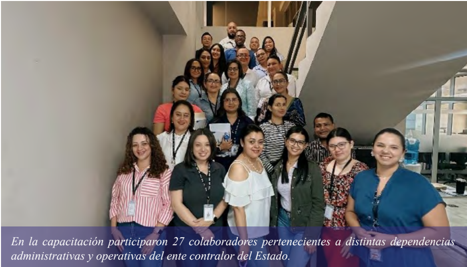
En la capacitación participaron 27 colaboradores pertenecientes a distintas dependencias administrativas y operativas del ente contralor del Estado.

Tegucigalpa. Con el objetivo de fortalecer las habilidades de comunicación escrita y la correcta elaboración de documentos institucionales, personal del Tribunal Superior de Cuentas (TSC) participó en la capacitación “Redacción General”.