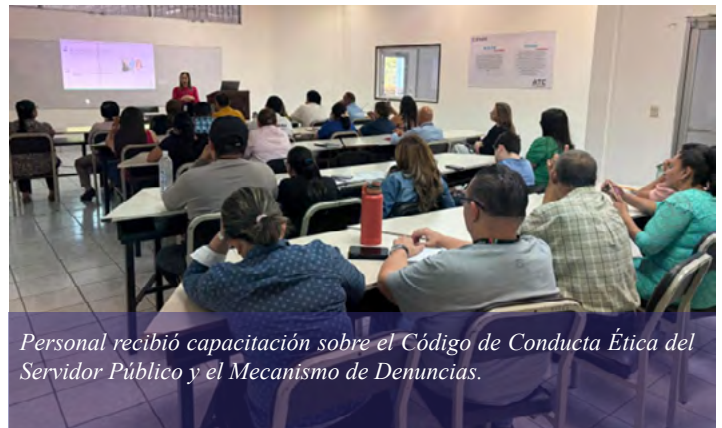
Personal recibió capacitación sobre el Código de Conducta Ética del Servidor Público y el Mecanismo de Denuncias.