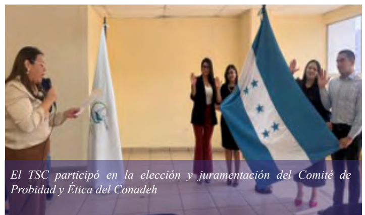
El TSC participó en la elección y juramentación del Comité de Probidad y Ética del Conadeh.