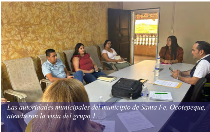
Las autoridades municipales del municipio de Santa Fe, Ocotepeque, atendieron la vista del grupo 1.