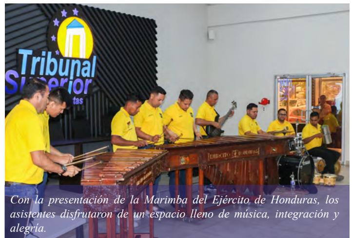
Con la presentación de la Marimba del Ejército de Honduras, los asistentes disfrutaron de un espacio lleno de música, integración y alegría.