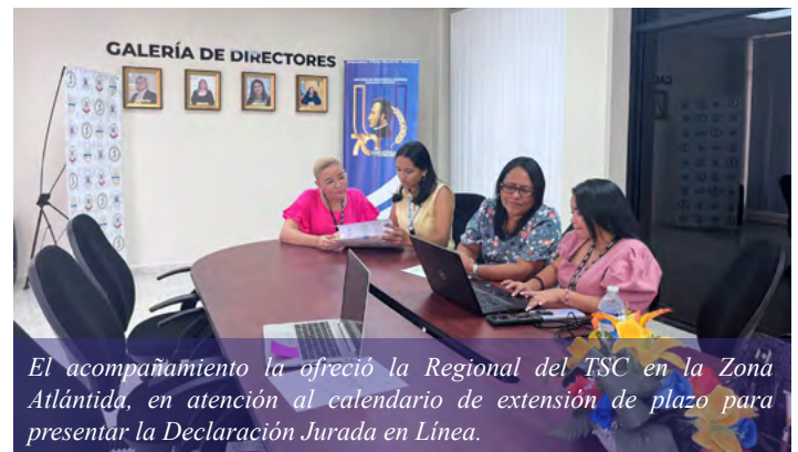
El acompañamiento lo ofreció la Regional del TSC en la Zona Atlántida, en atención al calendario de extensión de plazo para presentar la Declaración Jurada en Línea.

Esta Ley dispone que están obligados a presentar la declaración jurada de bienes los funcionarios que devenguen