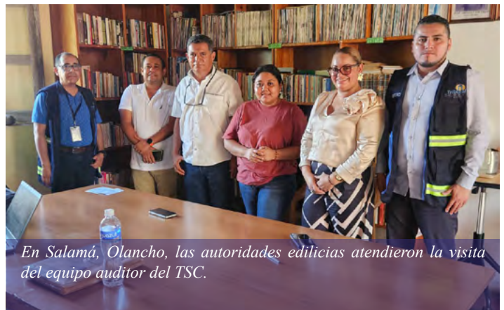
En Salamá, Olancho, las autoridades edilicias atendieron la visita del equipo auditor del TSC.