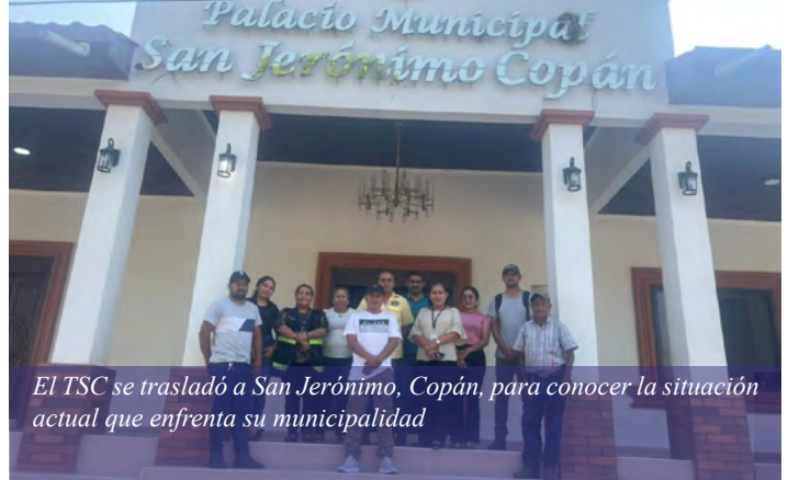
El TSC se trasladó a San Jerónimo, Copán, para conocer la situación actual que enfrenta su municipalidad