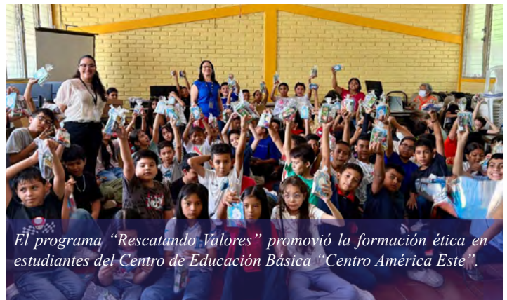
El programa “Rescatando Valores” promovió la formación ética en estudiantes del Centro de Educación Básica “Centro América Este”.