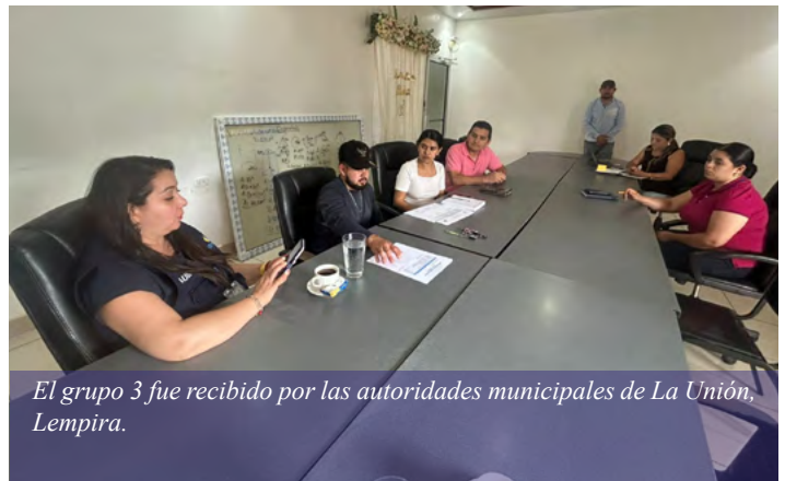
El grupo 3 fue recibido por las autoridades municipales de La Unión, Lempira.