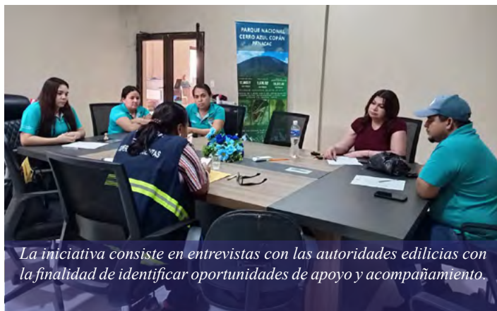
La iniciativa consiste en entrevistas con las autoridades edilicias con la finalidad de identificar oportunidades de apoyo y acompañamiento.