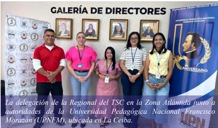
La delegación de la Regional del TSC en la Zona Atlántida junto a autoridades de la Universidad Pedagógica Nacional Francisco Morazán (UPNFM), ubicada en La Ceiba.

La Ceiba. El Tribunal Superior de Cuentas Honduras (TSC), brindó apoyo técnico a funcionarios y empleados de la Universidad Pedagógica Nacional Francisco Morazán (UPNFM), ubicada en La Ceiba, Atlántida, para la presentación de la Declaración Jurada de Ingresos, Activos y Pasivos, en Línea.