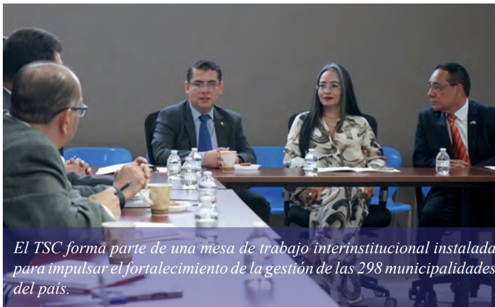
El TSC forma parte de una mesa de trabajo interinstitucional instalada para impulsar el fortalecimiento de la gestión de las 298 municipalidades del país.

Tegucigalpa. El Tribunal Superior de Cuentas (TSC) forma parte de una mesa de trabajo instalada para impulsar el fortalecimiento de la gestión de las 298 municipalidades del país.