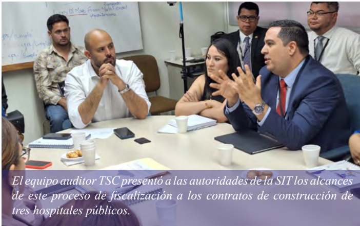
El equipo auditor TSC presentó a las autoridades de la SIT los alcances de este proceso de fiscalización a los contratos de construcción de tres hospitales públicos.