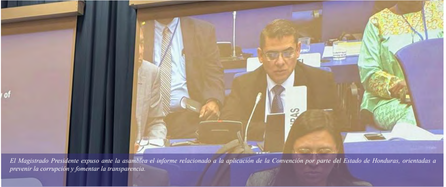
El Magistrado Presidente expuso ante la asamblea el informe relacionado a la aplicación de la Convención por parte del Estado de Honduras, orientadas a prevenir la corrupción y fomentar la transparencia.