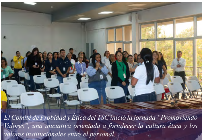
El Comité de Probidad y Ética del TSC inició la jornada “Promoviendo Valores”, una iniciativa orientada a fortalecer la cultura ética y los valores institucionales entre el personal.

Asimismo, para amenizar la actividad, se contó con la participación de la Marimba del Ejército de Honduras, brindando un espacio de convivencia y sana recreación para los asistentes.