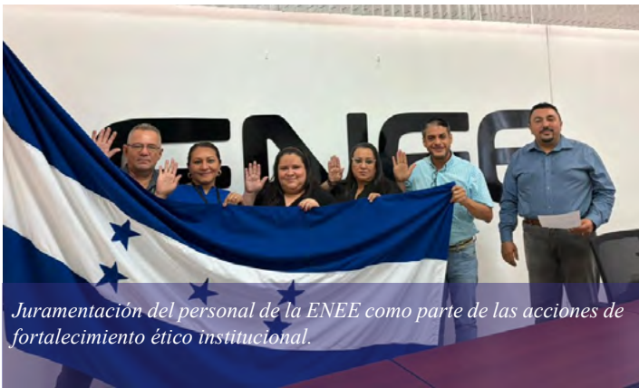
Juramentación del personal de la ENEE como parte de las acciones de fortalecimiento ético institucional.

El TSC seguirá impulsando la ética pública en todo el país. Para lograrlo, continuará apoyando de cerca el trabajo de los Comités de Probidad y Ética, buscando que la gestión pública sea cada vez más transparente y honesta.