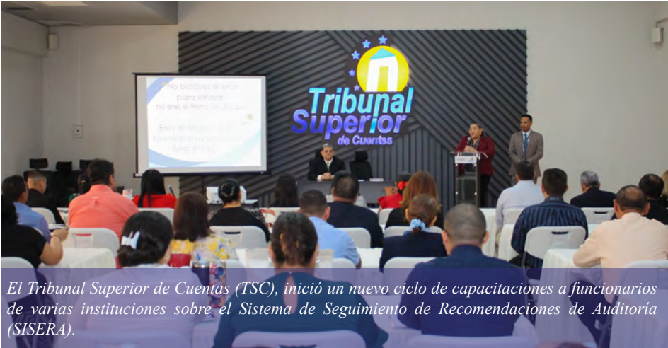
El Tribunal Superior de Cuentas (TSC), inició un nuevo ciclo de capacitaciones a funcionarios de varias instituciones sobre el Sistema de Seguimiento de Recomendaciones de Auditoría (SISERA).

Tegucigalpa. El Tribunal Superior de Cuentas (TSC), a través del Departamento de Verificación de Recomendaciones de Auditoría, de la Gerencia de Evaluación y Control de Calidad, completó las primeras jornadas de capacitación sobre el Sistema de Seguimiento de Recomendaciones de Auditoría (SISERA).