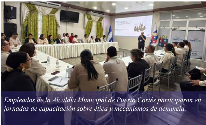
Empleados de la Alcaldía Municipal de Puerto Cortés participaron en jornadas de capacitación sobre ética y mecanismos de denuncia.