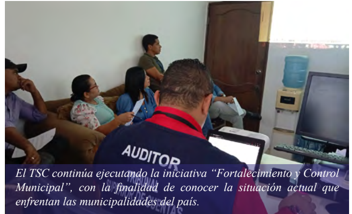
El TSC continúa ejecutando la iniciativa “Fortalecimiento y Control Municipal”, con la finalidad de conocer la situación actual que enfrentan las municipalidades del país.

Con la información que proporcionen las autoridades edilicias el TSC podrá identificar riesgos, oportunidades de mejora en la gestión pública municipal, promover la transparencia, optimizar el uso de los recursos y consolidar mecanismos de control interno.