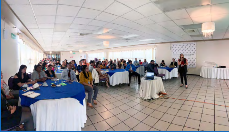
El contenido del nuevo Plan Estratégico Institucional del TSC, 2019-2024, fue socializado a el personal administrativo y operativo del Ente Contralor.

Tegucigalpa. El Plan Estratégico Institucional del Tribunal Superior de Cuentas (TSC), 2019-2024, fue socializado con todos los funcionarios y empleados del ente contralor del Estado.