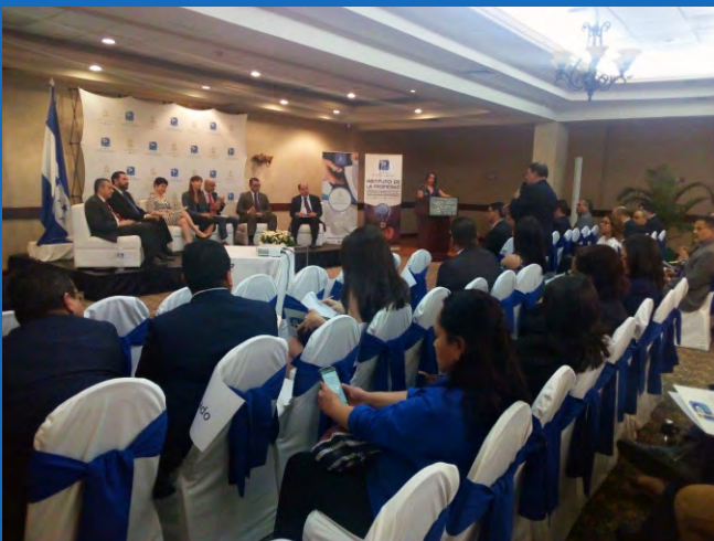
El foro sobre la Firma Electrónica y Gobierno Digital lució concurrido, por el alto perfil de los panelistas y la importancia del tema.

Tegucigalpa. Un grupo de procuradores de la Facultad de Derecho y autoridades del Consultorio Jurídico Gratuito, de la Universidad Nacional Autónoma de Honduras (UNAH), profundizaron conocimientos sobre las atribuciones y funciones del Tribunal Superior de Cuentas (TSC).