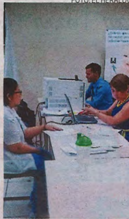
Ya iniciaron las brigadas móviles para la entrega de las declaraciones juradas.

Esta consistente en la declaración jurada móvil en los tres poderes del Estado que son: Legislativo, Ejecutivo y Judicial.