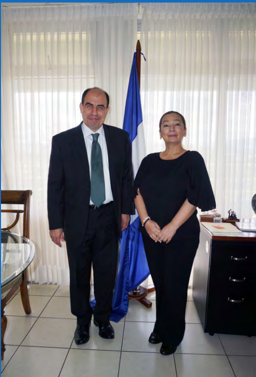
El magistrado presidente del TSC, Roy Pineda Castro, junto a la ministra de la Secretaría de Finanzas (Sefin), Rocío Tábor.

El nuevo Plan Estratégico Institucional 2019-2024 promueve el desarrollo de diferentes acciones con el propósito de contribuir a una gestión eficiente, eficaz e íntegra de los recursos públicos.