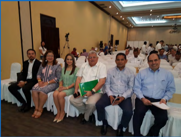
Las autoridades del TSC participaron como invitados en la XXIX Asamblea Nacional Ordinaria de Municipios, "Por el Respeto a la Autonomía Municipal".

titular del Congreso Nacional, Mauricio Oliva Herrera; subsecretarios de Estado, autoridades del Instituto de Acceso a la Información Pública (IAIP), representantes de organismos internacionales de cooperación y de la sociedad civil, entre otros invitados especiales.