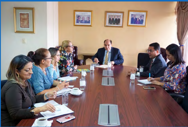
El TSC a través de las reuniones, busca un convenio entre el Ente Contralor y Unitec, con la Embajada de Chile para la certificación de los auditores.

Una de las prioridades del Pleno del TSC es la de mejorar el rendimiento de los auditores de la institución, mediante la formación especializada y certificada por la academia.