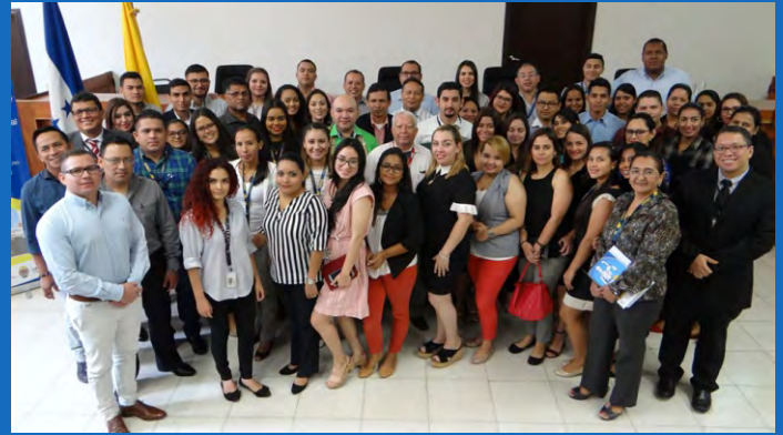
La conferencia fue dirigida a 35 procuradores y autoridades del Consultorio Jurídico y otros profesionales de Derecho.

“La temática abordada: “El Tribunal Superior de Cuentas, sus atribuciones y funciones constitucionales; la responsabilidad administrativa, responsabilidad civil, proceso de impugnaciones y la declaración jurada de activos y pasivos en el TSC”, fue de gran interés para el público presente y como parte del grupo que acompañó esa iniciativa pude constatar como su esfuerzo y colaboración dejó en alto el nombre de nuestra institución”, cita la nota.