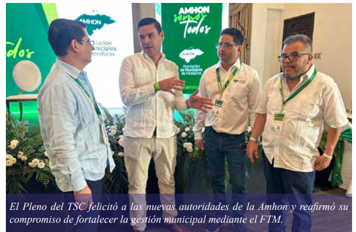
El Pleno del TSC felicitó a las nuevas autoridades de la Amhon y reafirmó su compromiso de fortalecer la gestión municipal mediante el FTM.

La conmemoración de la Asamblea Nacional de la Amhon constituyó un espacio clave para el fortalecimiento del municipalismo hondureño, que reunió a autoridades locales de todo el país.