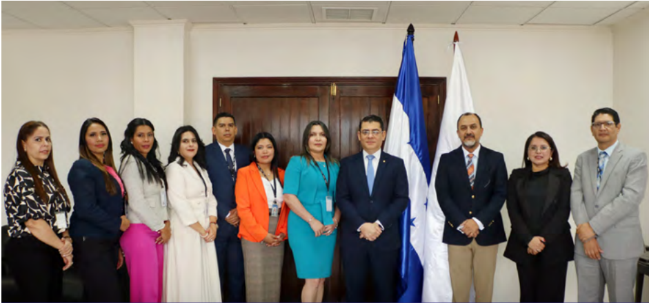
Los integrantes del nuevo Comité de Probidad y Ética y Comité Adjunto del TSC fueron electos democráticamente el 20 de marzo, con la participación de 481 empleados y funcionarios mediante votación virtual.