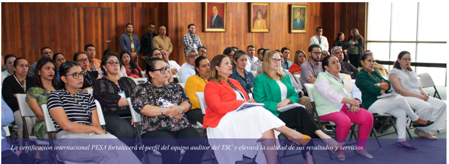
La certificación internacional PESA fortalecerá el perfil del equipo auditor del TSC y elevará la calidad de sus resultados y servicios.

La certificación internacional otorgado por el programa PESA se traducirá en elevar el perfil profesional del equipo auditor del TSC, ofrecer resultados de impacto y brindar un servicio con mayores niveles de calidad y profesionalismo.