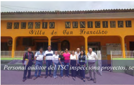
Personal auditor del TSC inspecciona proyectos, servicios públicos y estado físico de las municipalidades.