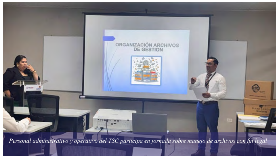
Personal administrativo y operativo del TSC participa en jornada sobre manejo de archivos con fin legal

El archivo de activos (fijos o documentales) como fenecidos es fundamental para cerrar el ciclo de vida de bienes y documentos, permitiendo la depuración eficiente de inventarios, la liberación de espacio físico/digital, el cumplimiento de normativas legales y la auditoría histórica de los recursos utilizados.