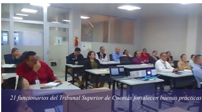
21 funcionarios del Tribunal Superior de Cuentas fortalecen buenas prácticas con archivos que llegaron a su fin legal.