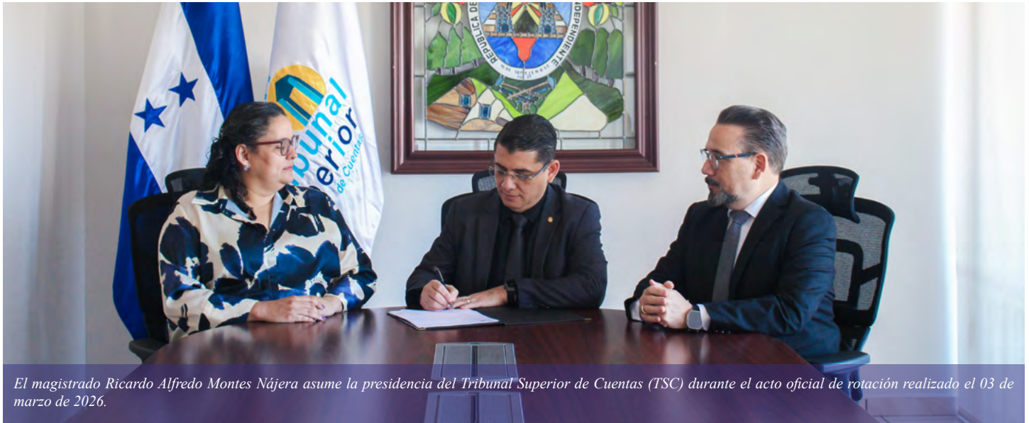
El magistrado Ricardo Alfredo Montes Nájera asume la presidencia del Tribunal Superior de Cuentas (TSC) durante el acto oficial de rotación realizado el 03 de marzo de 2026.

Tegucigalpa. En un acto oficial de rotación el magistrado Ricardo Alfredo Montes Nájera asumió el lunes 03 de marzo, 2026 la presidencia del Tribunal Superior de Cuentas (TSC).