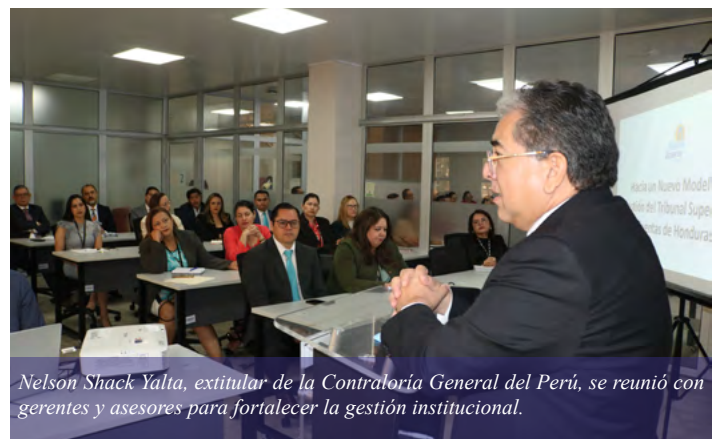
Nelson Shack Yalta, extitular de la Contraloría General del Perú, se reunió con gerentes y asesores para fortalecer la gestión institucional.

Por consiguiente se diseñó un plan a seguir para la implementación a corto plazo de una Operación Piloto