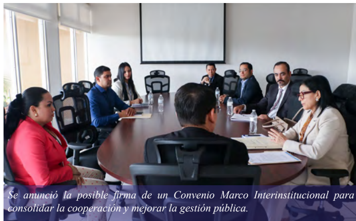
Se anunció la posible firma de un Convenio Marco Interinstitucional para consolidar la cooperación y mejorar la gestión pública.