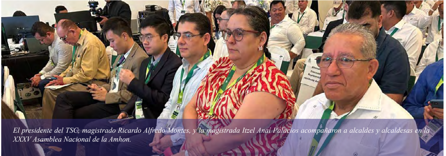
El presidente del TSC, magistrado Ricardo Alfredo Montes, y la magistrada Itzel Anaí Palacios acompañaron a alcaldes y alcaldesas en la XXXV Asamblea Nacional de la Amhon.

Tela, Atlántida. El Tribunal Superior de Cuentas (TSC) fue representado en la XXXV Asamblea Nacional de la Asociación de Municipios de Honduras (Amhon), celebrado en Tela, Atlántida, el 10 y 11 de marzo, 2026.