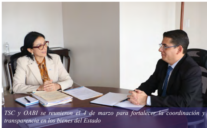
TSC y OABI se reunieron el 4 de marzo para fortalecer la coordinación y transparencia en los bienes del Estado

La OABI, por su parte, administra, resguarda y da destino a los bienes incautados en procesos judiciales, especialmente en casos de narcotráfico, corrupción y crimen organizado, garantizando que se usen de manera eficiente y en beneficio de la sociedad.