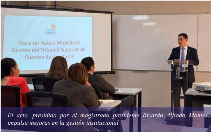
El acto, presidido por el magistrado presidente Ricardo Alfredo Montes, impulsa mejoras en la gestión institucional

de Control Concurrente, el cual contempla el alcance, el modelado del proceso de Control Concurrente y aprobación de normas, la formación de Comisiones de Control y capacitación sobre este mecanismo, la determinación de requerimientos, la contratación de profesionales, equipo, infraestructura y servicios y el despliegue en campó y remisión de reportes.