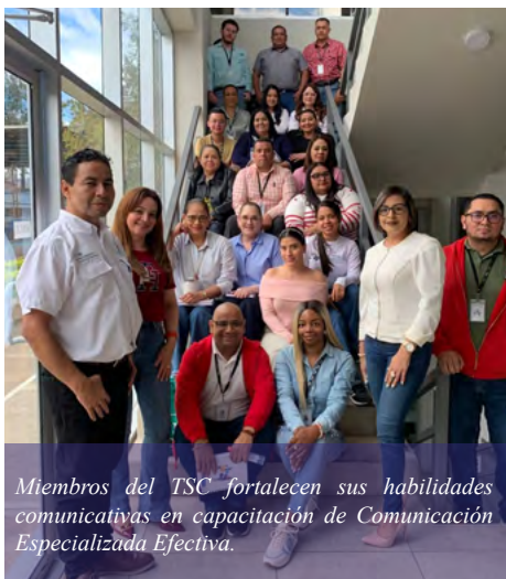
Miembros del TSC fortalecen sus habilidades comunicativas en capacitación de Comunicación Especializada Efectiva.

Tegucigalpa. Con el objetivo de fortalecer las habilidades