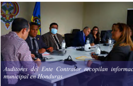
Audidores del Ente Contralor recopilan información clave en las alcaldías para fortalecer la gestión municipal en Honduras.