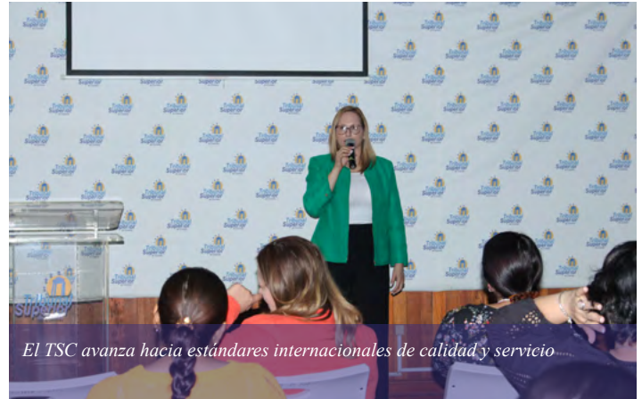
El TSC avanza hacia estándares internacionales de calidad y servicio

La magistrada calificó al equipo auditor como la columna vertebral del TSC, considerándolo como el