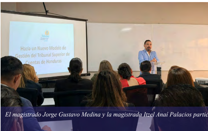
El magistrado Jorge Gustavo Medina y la magistrada Itzel Anai Palacios participan en el acto de fortalecimiento de la gestión institucional

De su parte, reafirmaron el compromiso de coordinar acciones de mejora institucional, que conduzcan al fortalecimiento del TSC que permitan una mayor efectividad en la prevención y combate del flagelo de la corrupción, para beneficio de la ciudadanía.