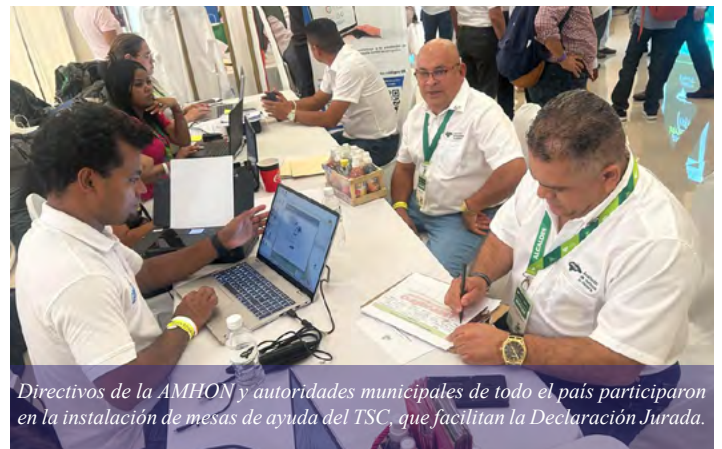
Directivos de la AMHON y autoridades municipales de todo el país participaron en la instalación de mesas de ayuda del TSC, que facilitan la Declaración Jurada.

Relacionado al tema, el TSC aprobó una prórroga para que los funcionarios y empleados obligados de los tres poderes del Estado, órganos constitucionales y corporaciones municipales, que tomaron posesión de sus cargos en enero y febrero, y a los que fueron cesados de sus cargos en estos meses, presenten la Declaración Jurada de Ingresos en un plazo de vencimiento al 30 de abril, 2026.