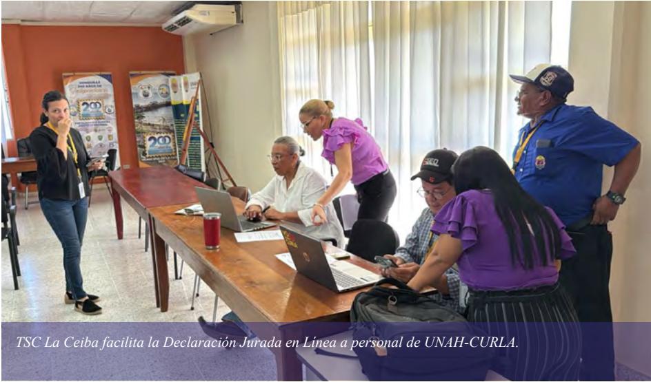
TSC La Ceiba facilita la Declaración Jurada en Línea a personal de UNAH-CURLA.

prestación del servicio a personal docente y administrativo obligado a declarar sus bienes ante el TSC, beneficiando con el ahorro de tiempo y economía.