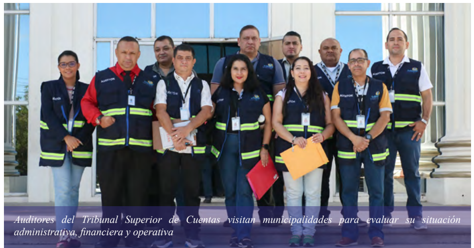
Audidores del Tribunal Superior de Cuentas visitan municipalidades para evaluar su situación administrativa, financiera y operativa

Con la información que proporcionen las autoridades edilicias el TSC podrá identificar riesgos, oportunidades de mejora en la gestión pública municipal, promover la transparencia, optimizar el uso de los recursos y