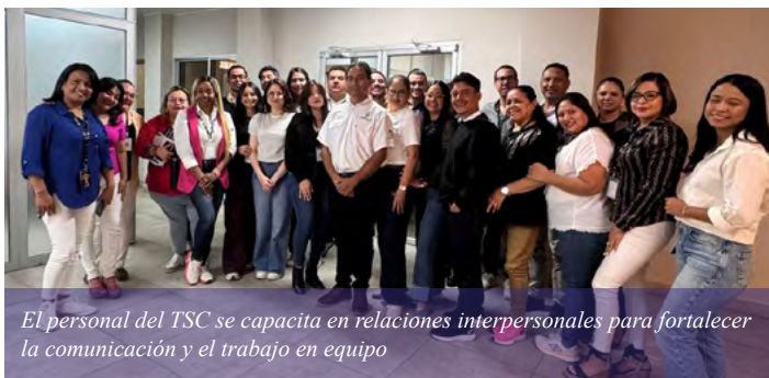
El personal del TSC se capacita en relaciones interpersonales para fortalecer la comunicación y el trabajo en equipo

Tegucigalpa. El personal del Tribunal Superior de Cuentas (TSC) recibió una capacitación en Relaciones Interpersonales, con el objetivo de fortalecer la comunicación efectiva, el trabajo en equipo, la empatía y el manejo de conflictos, buscando mejorar las relaciones en el entorno laboral, fomentar un clima organizacional positivo y aumentar la productividad.