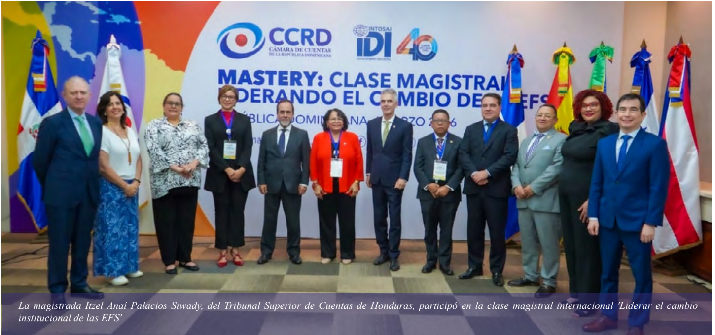
La magistrada Itzel Anaí Palacios Siwady, del Tribunal Superior de Cuentas de Honduras, participó en la clase magistral internacional 'Liderar el cambio institucional de las EFS'

Santo Domingo. Con una jornada de alto nivel técnico y reflexivo, concluyó la clase magistral internacional “Liderar el cambio institucional de las Entidades Fiscalizadoras Superiores (EFS)”, celebrado en República Dominicana.