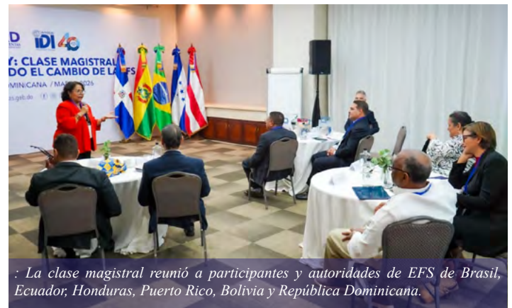
La clase magistral reunió a participantes y autoridades de EFS de Brasil, Ecuador, Honduras, Puerto Rico, Bolivia y República Dominicana.

La exitosa culminación de esta jornada académica consolida al TSC en la promoción de buenas prácticas en fiscalización superior, reafirmando su compromiso con el fortalecimiento institucional y al servicio del interés público.