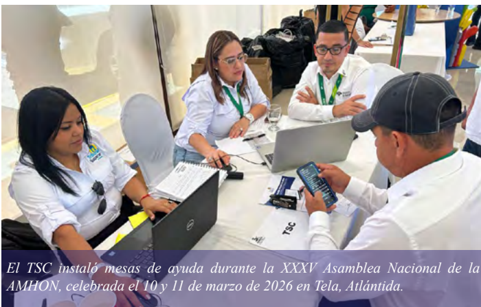
El TSC instaló mesas de ayuda durante la XXXV Asamblea Nacional de la AMHON, celebrada el 10 y 11 de marzo de 2026 en Tela, Atlántida.