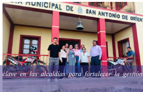
Personal auditor del TSC inspecciona proyectos, servicios públicos y estado físico de las municipalidades.