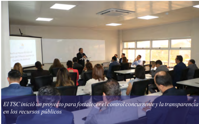
El TSC inició un proyecto para fortalecer el control concurrente y la transparencia en los recursos públicos

Tegucigalpa. El Tribunal Superior de Cuentas (TSC) inició un ambicioso proceso de fortalecimiento del control concurrente con la finalidad de constatar la transparencia en la gestión de recursos manejados por las instituciones del sector público.