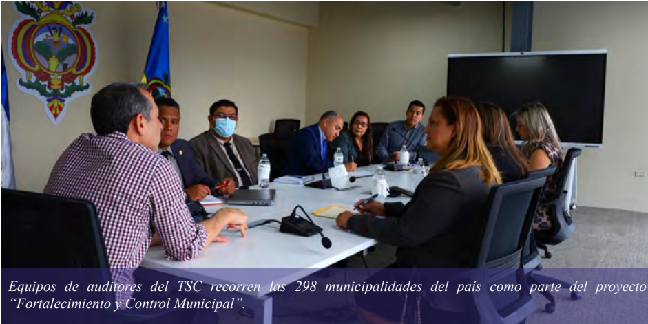
Equipos de auditores del TSC recorren las 298 municipalidades del país como parte del proyecto “Fortalecimiento y Control Municipal”.