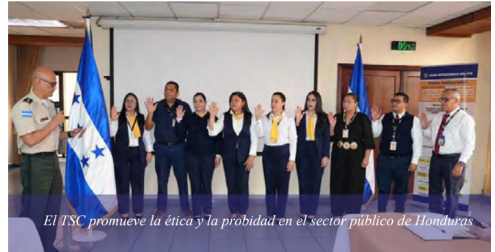
El TSC promueve la ética y la probidad en el sector público de Honduras

la ética pública en el territorio nacional, incentivando a los miembros de los distintos Comités a desarrollar su trabajo sustentado en el Código de Conducta Ética del Servidor Público.