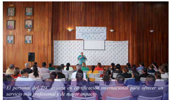
El personal del TSC avanza en certificación internacional para ofrecer un servicio más profesional y de mayor impacto

Como producto de la gestión del Pleno, un total de 100 auditores de distintas áreas operativas del TSC iniciaron, en octubre del año 2024, el proceso de certificación al formar parte del PESA, quienes cumplían con los criterios de selección requeridos para formar parte del programa de alto prestigio internacional, dedicando