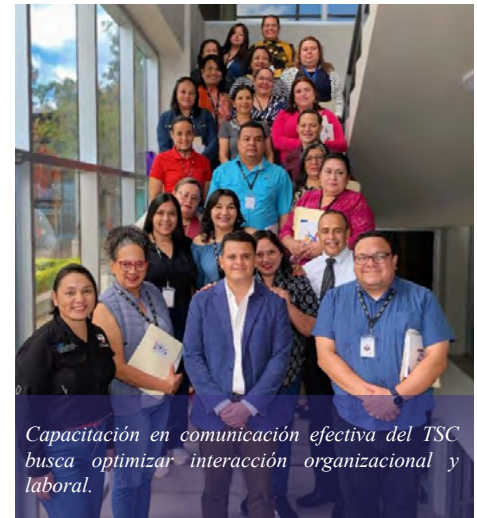
Capacitación en comunicación efectiva del TSC busca optimizar interacción organizacional y laboral.

Esta capacitación fortalecerá las habilidades de comunicación del personal, facilitando que los procesos internos sean más claros