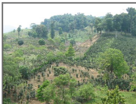
Imagen N° 2

Deforestación en el área de influencia de la Cuenca del Lago de Yojoa