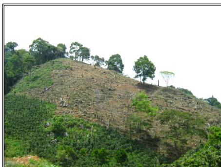
Imagen N° 1

En las giras de campo realizadas en los municipios del área de influencia (Las Vegas, San Pedro de Zacapa, Departamento de Santa Bárbara, San José de Comayagua y Taulabé, Departamento de Comayagua y Santa Cruz de Yojoa, Departamento de Cortés), en los cuales a manera general se verificó que existe una deficiente presencia institucional, ya que el deterioro ambiental de la cuenca del Lago de Yojoa es evidente y creciente, por lo tanto no cumplen con los objetivos establecidos.