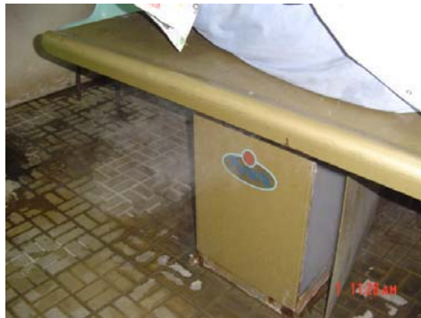
Disipador de calor en mal estado