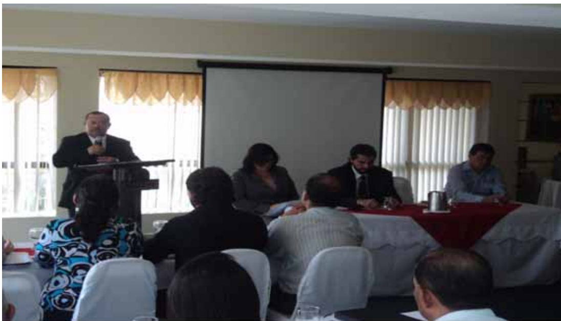
El Director de Auditoría Municipal dando unas palabras de bienvenida a todos los funcionarios que asistieron al evento de Gestión Municipal 2010 en la ciudad de San Pedro Sula.