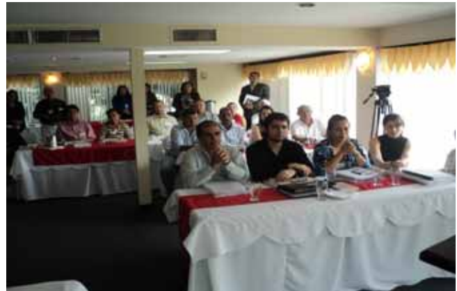
Autoridades de las diferentes municipalidades muy atentas a las charlas que se ofrecen en el Seminario Gestión Municipal 2010