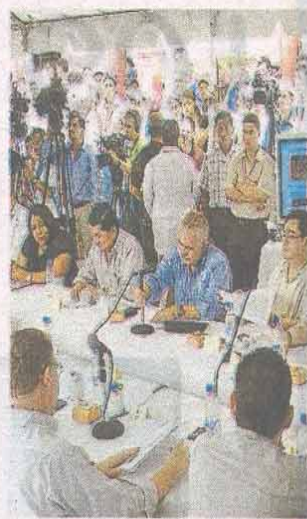
Más de tres horas duró ayer el consejo.

En el consejo también se aprobó un decreto sobre la creación de la Dirección General del Régimen Departamental