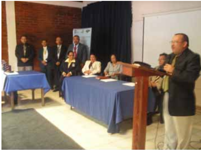
El Director de Auditoría Municipal del TSC, Guillermo Mineros al inaugurar el Taller de los Auditores Municipales de seis departamentos, dió inicio al plan de capacitación del personal de las 298 corporaciones del País, según lo programado por este entre controlador.

Los auditores internos de las municipalidades de seis departamentos asistieron el 12 de julio a Valle de Ángeles para participar en el seminario taller sobre Auditoría Interna, que impartió el Tribunal Superior de Cuentas, con apoyo del Ministerio de Gobernación y la Asociación de Municipios de Honduras (AMOHN).