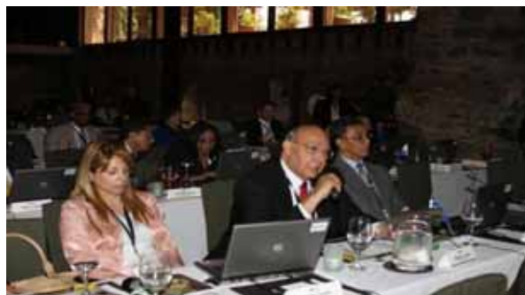
Participación del Magistrado Presidente del T.S.C y Director de la Secretaría Ejecutiva de la OLACEFS