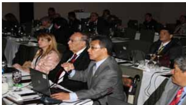
Participación del Magistrado Jorge Bográn en la XX Asamblea General Ordinaria de la OLACEFS

Asimismo, se creó una base de datos, nombre, sueldos y procesos de elección de los empleados y funcionarios de la administración pública y la importancia de la ética en la fiscalización de los bienes del Estado al igual que la independencia de las auditorías, dijo.