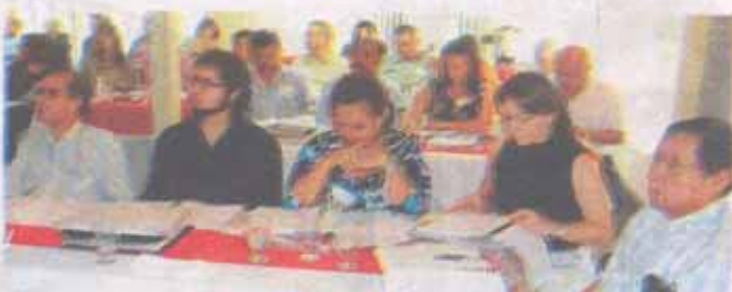
Varios funcionarios de los municipios del Valle de Sula recibieron el seminario, el cual tuvo una duración de cinco horas.

dano podrá obtener a través de la red para conocer cómo se está administrando el municipio y en qué se está invirtiendo el dinero del pueblo.