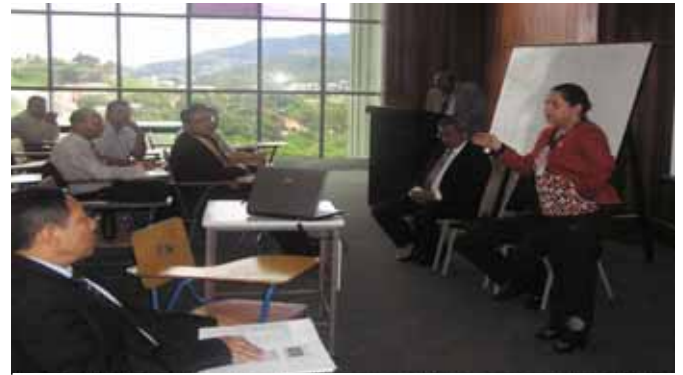
La Magistrada Daysi de Anchecta al inaugurar el taller sobre control y auditoría interna pidió a los auditores del TSC reflexionar sobre su delicado papel en la prevención y combate a la corrupción

Se necesita contar con un personal de gran calificación profesional y que actúe con transparencia en las labores que se le encomiende y, permitir de esa manera, alto grado de credibilidad en el rol del Tribunal Superior de Cuentas, en su misión de prevenir y combatir la corrupción en la administración pública, expresó la Magistrada de la entidad contralora, Daysi de Anchecta al inaugurar el viernes 9 de julio, el taller sobre el Marco Rector del Control y de la Auditoría Interna.