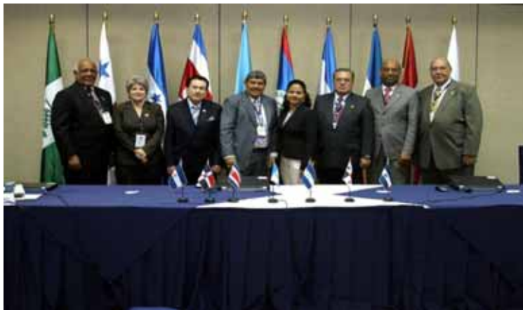
Miembros del Consejo Fiscalizador Regional del Sistema de la Integración Centroamericana (CFR-SICA) asisten a la V reunión realizada en Antigua Guatemala.

El plan anual de auditoría y presupuesto para el próximo año y la guía para la planificación estratégica quinquenal fueron abordados por los delegados de la Organización Latinoamericana y del Caribe de Entidades Fiscalizadoras Superiores (OLACEFS), al participar en la V reunión del Consejo Fiscalizador Regional del Sistema de Integración Centroamericana (CFR-SICA), realizada en Antigua Guatemala el 4 del este mes. En el marco de la XX asamblea general ordinaria de la OLCAFS realizada en la ciudad guatemalteca el Consejo Fiscalizador del SICA (CFR-SICA) se dejó plasmado en el documento del plan anual de auditoría y presupuesto correspondiente al año 2011 las actividades que se procura realiza en el próximo año, se presenta el Diagnóstico FODA, orientado a identificar las fortalezas y oportunidades que es necesario aprovechar para lograr mejores resultados. Asimismo, se conoció la guía para la