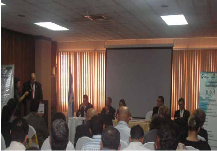
El Presidente del TSC Miguel Ángel Mejía Espinoza inaugura en esta capital el “V Seminario Gestión Municipal 2010”

El Presidente del Tribunal Superior de Cuentas, Miguel Ángel Mejía Espinoza inauguró el programa anual de capacitación de funcionarios y empleados municipales del presente año, el lunes 19 de julio, en uno de los hoteles capitalinos, al cual asistieron representantes de ocho alcaldías de este departamento de Francisco Morazán.