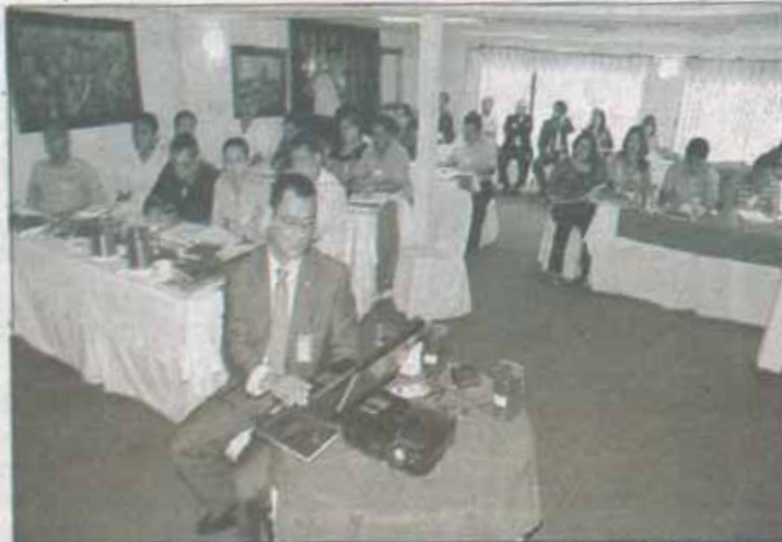
Con las jornadas educativas el TSC busca mejorar el conocimiento de las leyes de los alcaldes y funcionarios municipales.

El Tribunal Superior de Cuentas (TSC), la Secretaría de Gobernación y el Instituto de Acceso a la Información Pública dieron a conocer a varios alcaldes y funcionarios del departamento de Cortés, lineamientos que se deben tomar en cuenta para la rendición de cuentas y transparencia de las municipalidades.