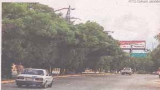
En este sector del bulevar del Este los árboles están muy altos y pueden afectar el tendido.